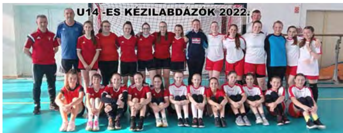
U14 -ES KÉZILABDÁZÓK 2022.

Kézilabdás lányaink Székelyhíd korosztályos gárdáival mérték össze tudásuk: U10 és U15 korcsoportokban. A tornacsarnokba kilátogató nézők nagy elánnal buzdították mindkét csapatot.