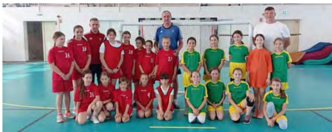
U10 -es kézilabdások

Úszó szakosztályunk versenyzői május hónap végén a békéscsabai Viharsarok-Kupán vettek részt. Az időjárás nem volt kegyes a versenyzőkhöz, ennek ellenére úszóink valamennyi versenyszámukat teljesítették.