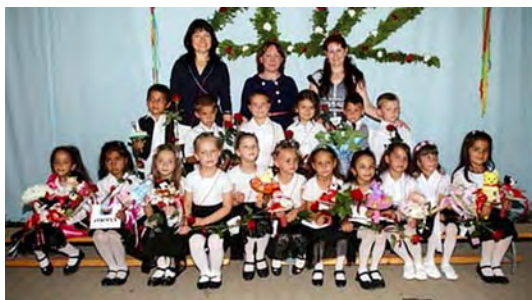
A Kisvirág csoport